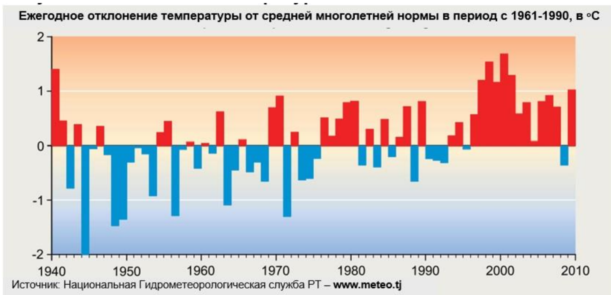
Рисунок 1. Изменение температуры в Таджикистане

12. Наблюдаемые изменения в длительности безморозного сезона, определяется как число безморозных дней (дни, превышающие 0.2^{\circ}\text{C} ) в течение года, отражают увеличение численности сезонных температур. Безморозные дни отражают тенденции потепления зимних температур. Каждый год было на 5-10 безморозных дней больше. Дни, когда средние температуры регистрируются выше нуля, теперь приходятся на раннюю весну и позднюю осень.