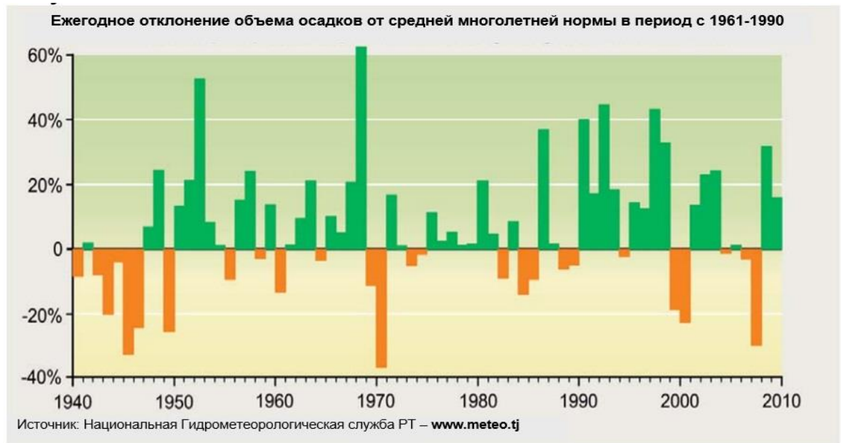
Рисунок 2. Изменения осадков в Таджикистане

14. Продолжающееся таяние и отступление ледников, связанные с изменением климата, вызывает озабоченность для Таджикистана, так как ледники и снежные запасы Таджикистана являются основными источниками ирригационной воды. Примерно 30% ледникового покрова утрачено с 1930 года; текущая скорость таяния составляет потери в годовом измерении 0,5%-0,8%. Самый большой ледник в Таджикистане Ледник Федченко, отступил на расстояние в 1 км, и потерял около 5 км льда с начала XX века (рисунок 3). Небольшие ледники в низовьях получают наибольшее влияние от изменения климата и тают с беспрецедентными темпами. Например, в Диахандаре, ледник с площадью поверхности менее 1 км 2 , расположенный в верховье реки Каратаг, полностью растаял. Размер Зеравшанского ледника уменьшился на 10% в период между 1927- 2010 гг., и отступил на 2,5 км.